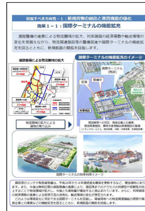
施策別説明パネル