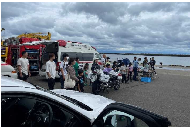
「はたらく車大集合」

大会は、奥尻港を発着としたコースであり、沿道につめかけた観衆の声援をうけ、園児・児童・生徒・一般の約210名が力走しました。