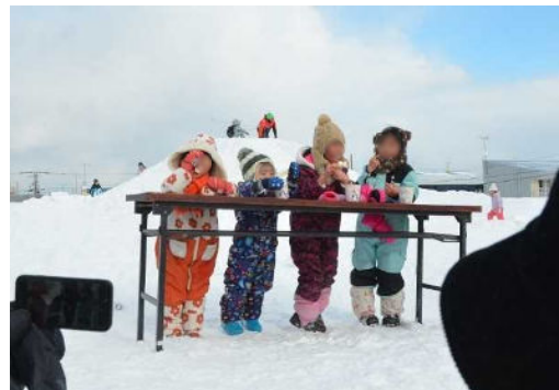
※写真は昨年の様子