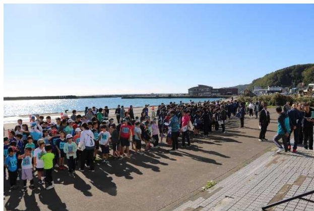
第32回町民体育祭「マラソン大会」