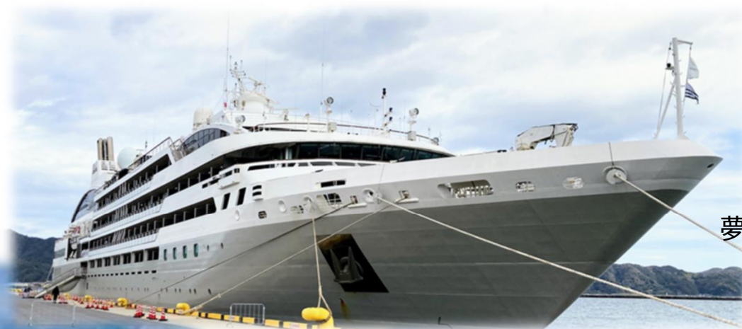
夢みなとターミナル

このエリアの魅力を最大限引き出すにはどのような仕掛けが必要かを検証すべく、クルーズ船寄港に併せ、①地元住民による魅力再発見、②地元住民がクルーズ船に親しむこと、を目的に写真展、写真ワークショップ、ドッグラン、飲食等出展、コンサートなど多様な企画を組み合わせた賑わい形成の実証事業を試みた。